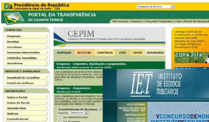
SITE PORTAL DA TRANSPARÊNCIA

Outra irregularidade do sistema tributário brasileiro apontada pelo economista é que a maior extração do Fisco ocorre sobre a classe de menor renda. Segundo ele, a classe de maiores ganhos paga menos impostos. Ao comparar o Brasil com os países bem colocados no ranking mundial, Meneghetti ressalta a importância de um embate saudável entre a população e o governo, para que se tenha presente o questionamento do que é “imposto” e do que não é.