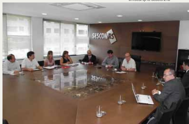
REUNIÃO NO SESCON/RS CONFIRMOU CONESCAP EM GRAMADO, EM 2013