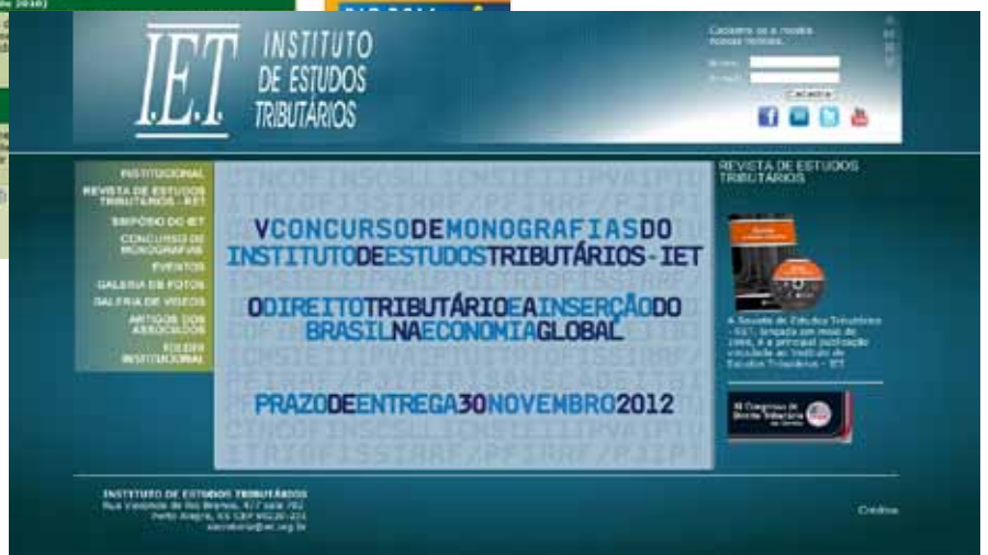
SITE INSTITUTO TRIBUTÁRIO BRASILEIRO