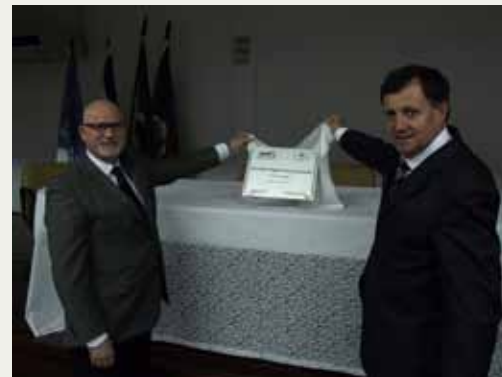
SESCON/RS EM LAJEADO

O Sescon-RS estará mais perto de seus representados do Vale do Taquari. A entidade inaugurou, em parceria com a Aescon/Sincovat, o seu escritório regional em Lajeado. O espaço vai oferecer cursos, palestras, capacitações, além de ser um local para reuniões das empresas de serviços da região. O