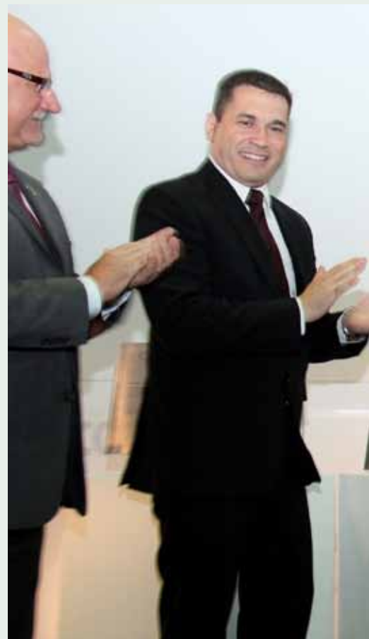
FAMILIARES DE GATTI RECEBENDO A H

É da alçada dele a criação, em 1983, da Associação Profissional