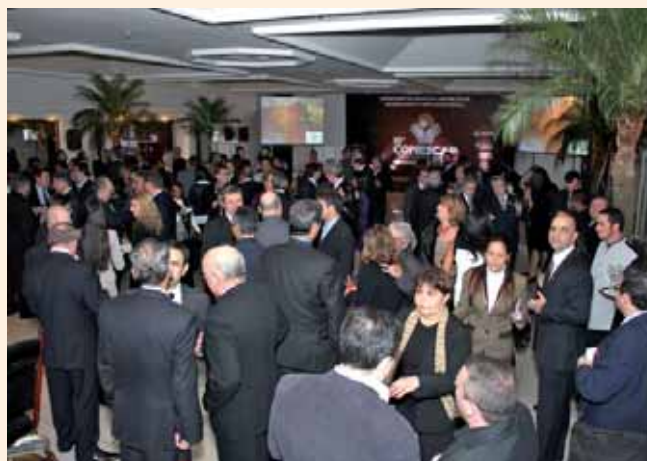
EVENTO DE LANÇAMENTO DO 15º CONESCAP