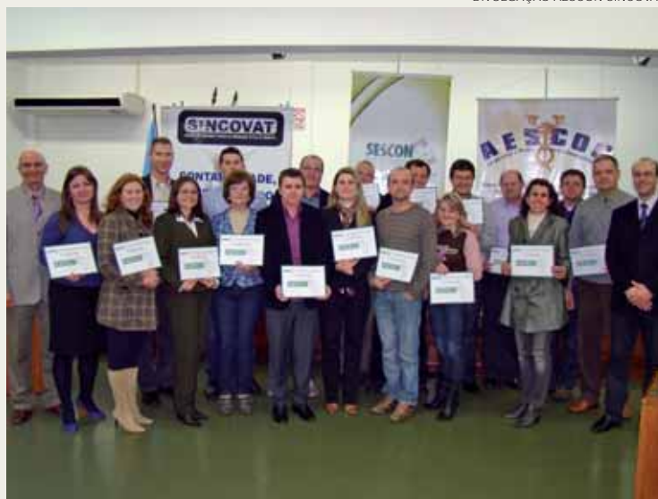
FORMATURA DOS CONSULTORES CONTÁBEIS