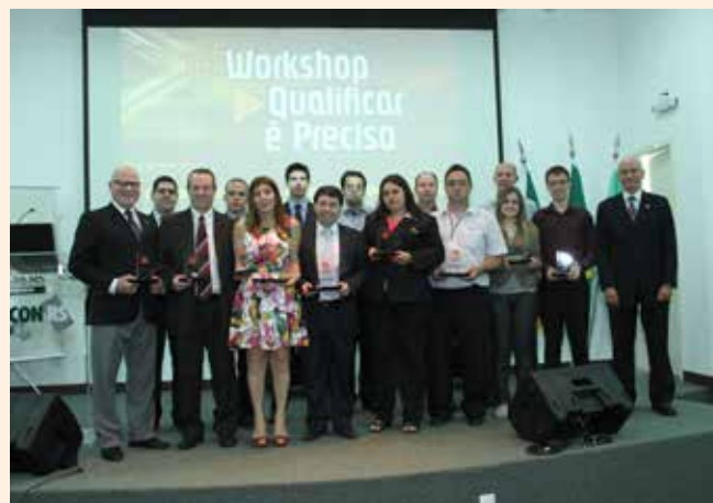
WORKSHOP QUALIFICAR É PRECISO