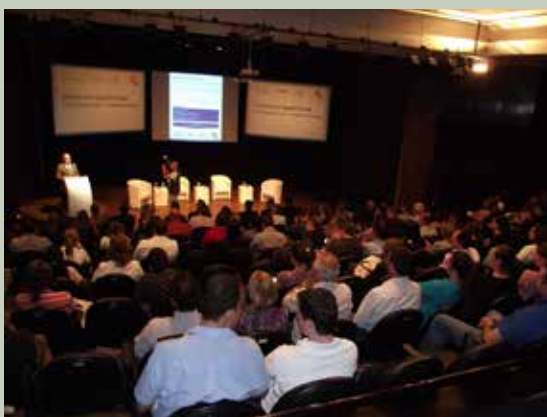
EVENTO NA FECOMÉRCIO-RS DEBATEU A NOVA SISTEMÁTICA TRIBUTÁRIA

a ITG 1000, posta em audiência pública pelo CFC, que pretende alterar a sistemática contábil para micro e pequenas empresas.