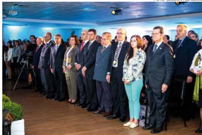
MAIS DE 300 EMPRESÁRIOS