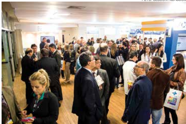
FEIRA DE NEGÓCIOS