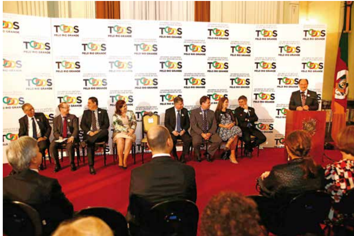
GOVERNADOR JOSÉ IVO SARTORI APRESENTOU O PROJETO NO PALÁCIO PIRATINI