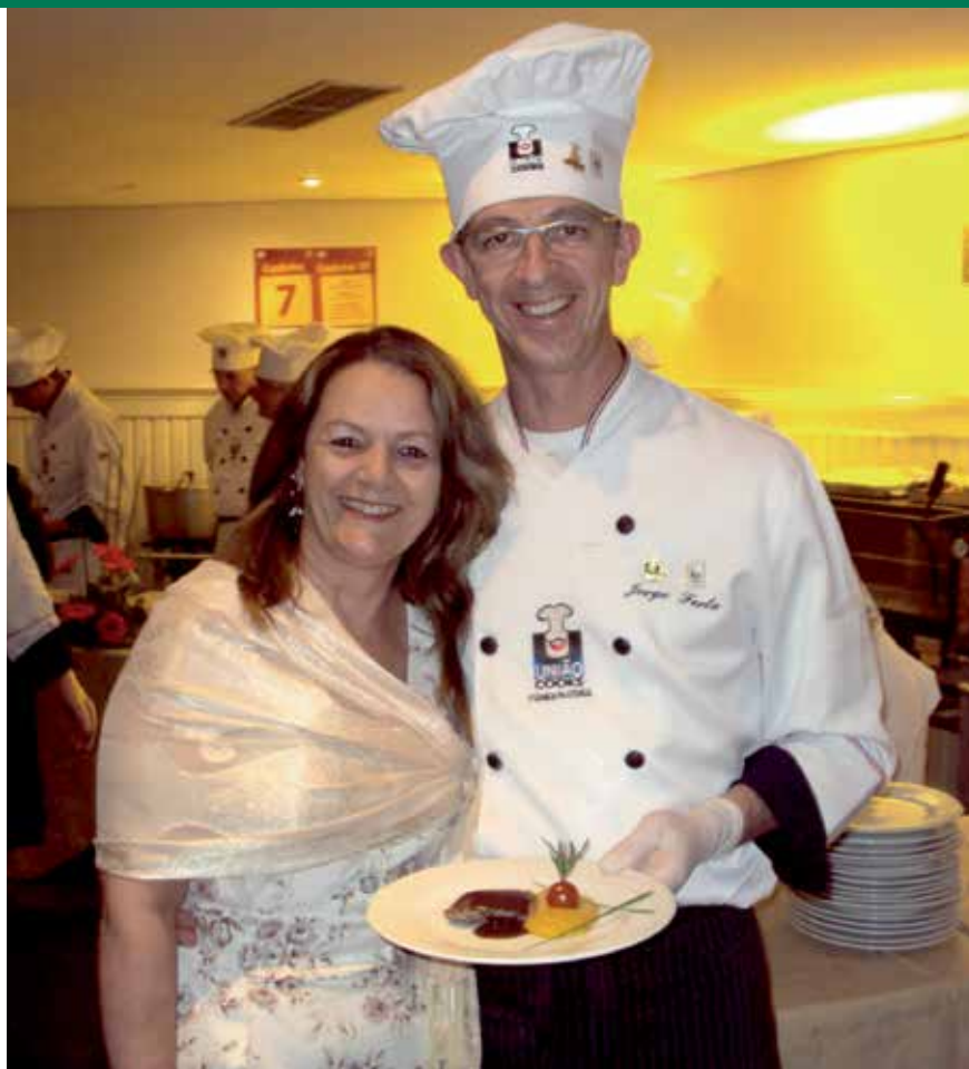
O CHEF E ESPOSA NA CONFRARIA DO UNIÃO COOKS

Mas o prato principal estava para acontecer e o iniciante de cozinha mal sabia o significado trazido em meio ao óleo de oliva e o fogo alto para selar um bom filé. O primeiro passo foi sua total identificação com a alta gastron-