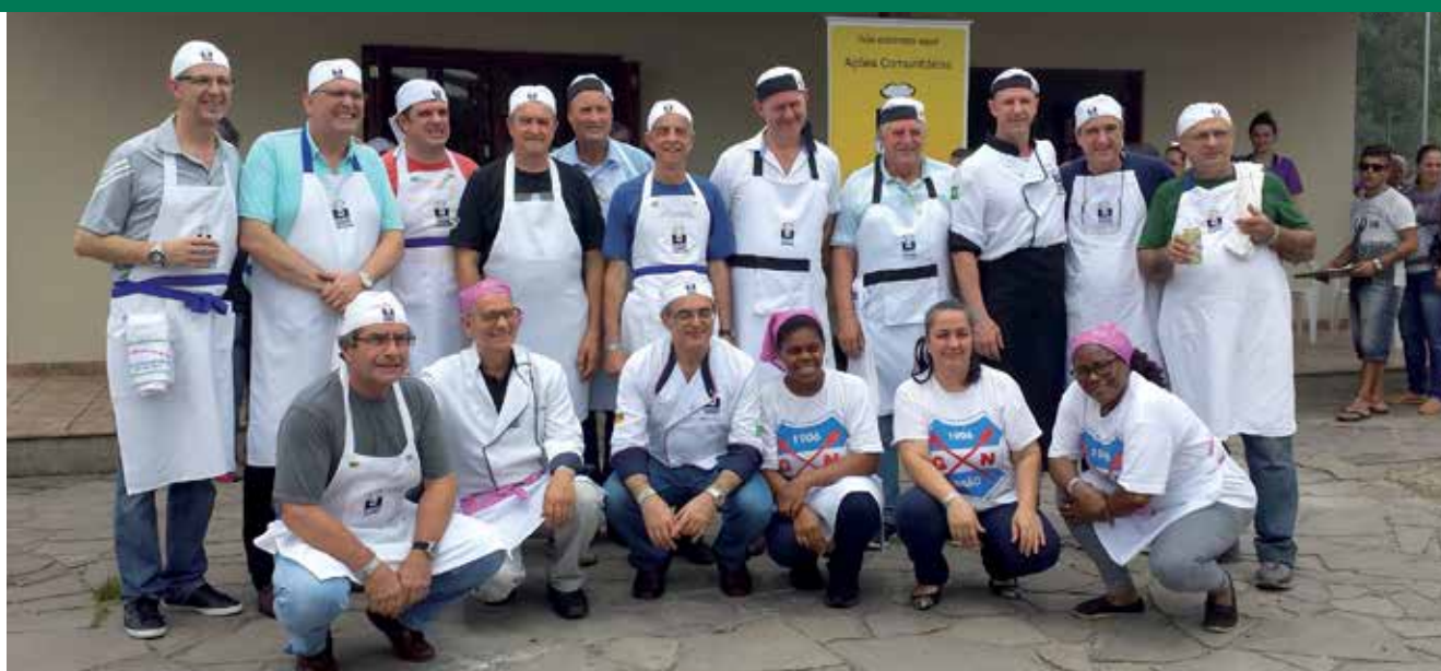
ALÉM DO APRENDIZADO NA CONFRARIA, OS COZINHEIROS COLABORAM COM AÇÕES SOCIAIS NO ESTADO

idosos que são atendidos por entidades sociais. “Foi aí que aprendi a verdadeira lição que não estava nos livros de receitas: a confraria dos Cooks é uma irmandade onde aprendi a praticar minha principal vocação, que é a solidariedade”.