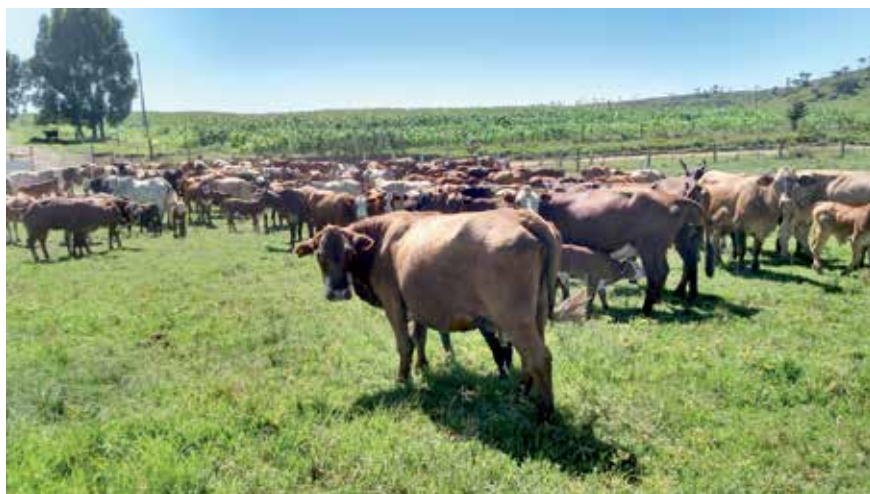
GADO DE CORTE DA FAZENDA SANTA VITÓRIA

a comercialização de touros e de gado de corte faz parte da estratégia de diversificação do negócio no campo, principalmente com a reprodução de novas matrizes de zebuínos. O gado de corte tem sua comercialização entre dezembro e maio, quando os animais atingem 520 kg, peso ideal para o abate.