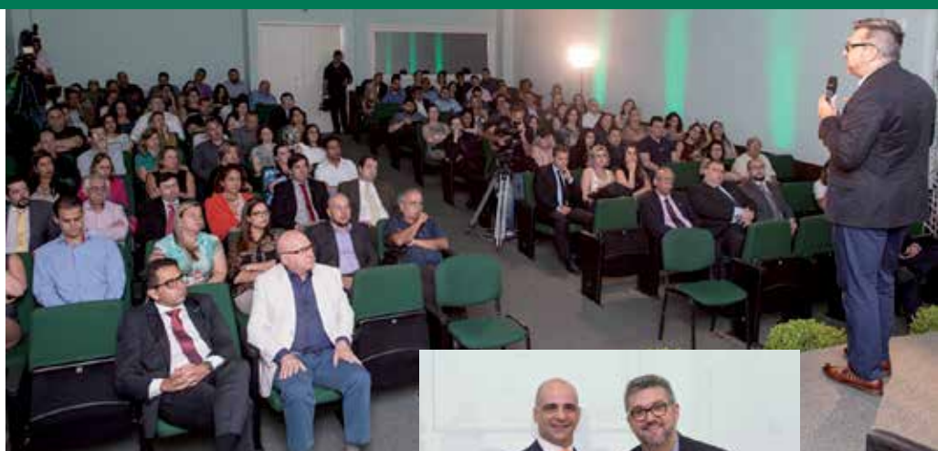
A GESTÃO DAS EMPRESAS CONTÁBEIS

São aproximadamente oitenta mil empresas de contabilidade em todo o país, cerca de nove mil apenas aqui no Rio Grande do Sul. Esse expressivo número demonstra a importância do segmento para a economia brasileira. “O empresário contábil é o técnico assessor, que atende grande parte do PIB