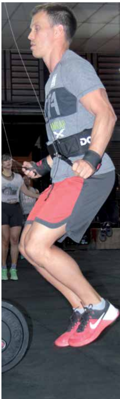
FORÇA FÍSICA FAZ PARTE DOS TREINOS

de verão. “Não tenha como objetivo único à perda de peso ou qualquer questão estética (a não ser em casos extremos). Foque na rotina, na reeducação alimentar, na concentração da prática esportiva e os resultados virão como consequência”.