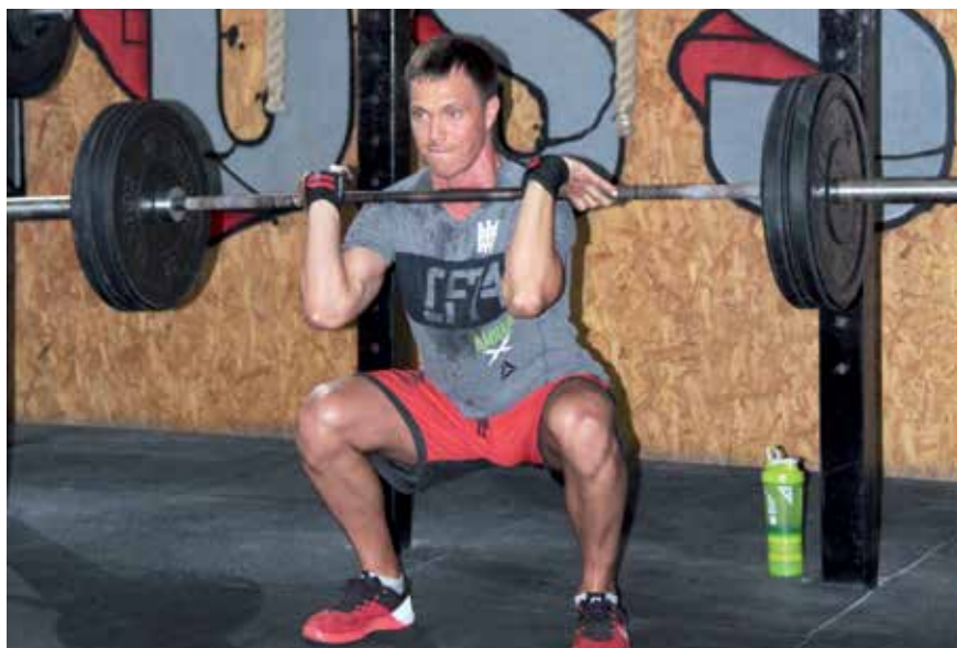
ATIVIDADE FÍSICA NO CROSS FIT

“Desde os 21 anos de idade resolvi mudar o meu estilo de vida, investindo na minha alimentação. Não bebo nada de álcool, nunca fumei ou usei qualquer tipo de droga. Sou autodidata no que diz respeito à alimentação saudável. Estou sempre buscando novidades e adequando a minha alimentação. Porém a minha rotina não é de privação, modismos ou extremismos.