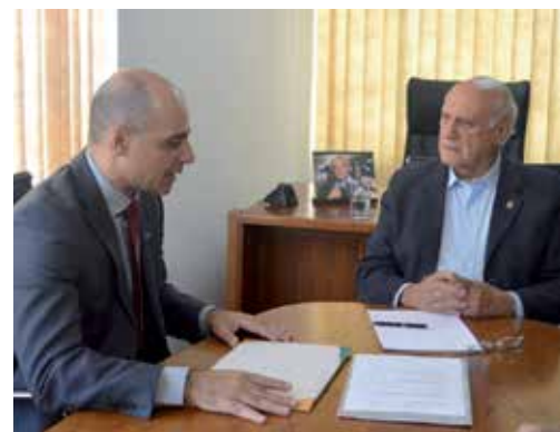
COM O SEN. LASIER MARTINS

zesse o mesmo. Lasier, por sua vez, garantiu apoio a matéria e também se interessou pelos relatórios do Gestão Pública Eficaz, principalmente aos que se referem aos gastos do Poder Legislativo.