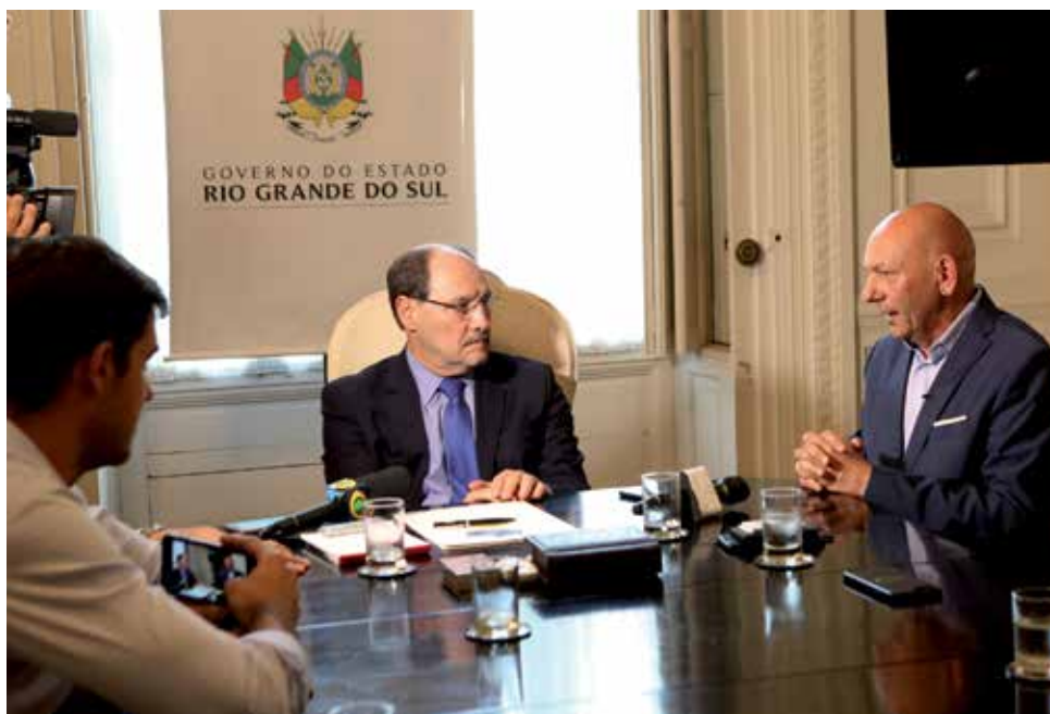
PRESIDENTE DA HAVAN ANUNCIOU INVESTIMENTOS AO GOVERNADOR

A boa notícia da Havan, com investimentos e empregos diretos no Estado, não afastam as dificuldades conhecidas que atrasam o desenvolvimento e oportunidades para as novas gerações.