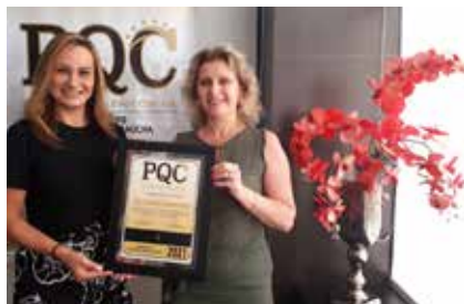
BIACE ASSESSORIA E CONTABILIDADE

Ao alcançar os requisitos exigidos, a participante é reconhecida, conquistando o direito de utilizar a marca do PQC correspondente ao nível em que for avaliada. A cada ano, o ciclo se repete, permitindo aos interessados a manutenção do reconhecimento obtido, bem como a evolução para níveis superiores.