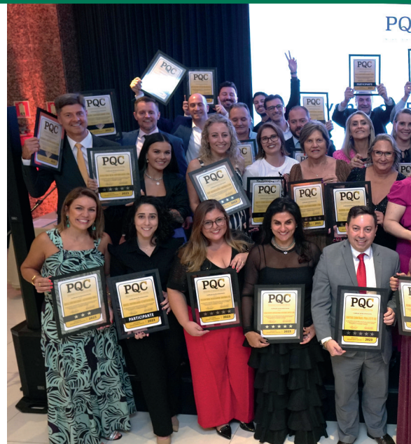
EMPRESAS DE SERVIÇOS CONTÁBEIS NA CERIMÔNIA

Importante destacar “que, entre outras exigências do nosso dia a dia das nossas atividades, somando com a dedicação extra em participar do PQC, o resultado, em sua essência, é que as empresas agraciadas desenvolvam o mais alto nível de busca de resultados e longevidade”, comentou o presidente do