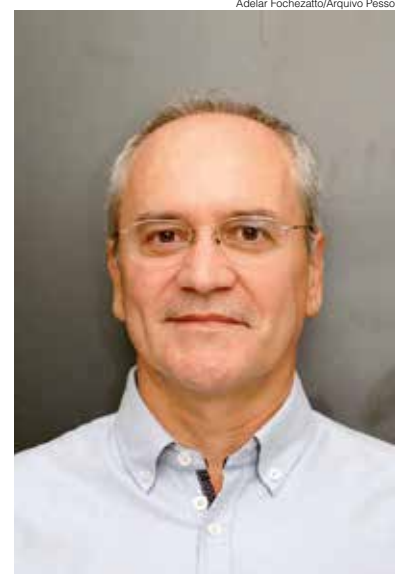
Adelar Fochezatto/Arquivo Pessoal

O alto crescimento populacional nesses municípios ainda não está se refletindo em aumento da atividade econômica, do empreendedorismo e de oportunidades de