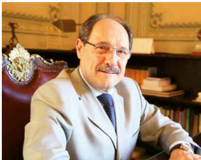
JOSÉ IVO SARTORI

Após se inteirar da situação econômica e financeira do Estado, o Governador José Ivo Sartori mostra a realidade das finanças e o difícil caminho que terá pela frente. Com recursos zerados para investimentos, já anunciou dificuldades em cumprir com o custeio da máquina estatal, inclusive com o pagamento, em dia, do funcionalismo público. Sartori critica o poder estatal ao afirmar “que infelizmente o Estado parou no tempo, perdeu a qualidade e não tem mais sequer sustentabilidade financeira”.