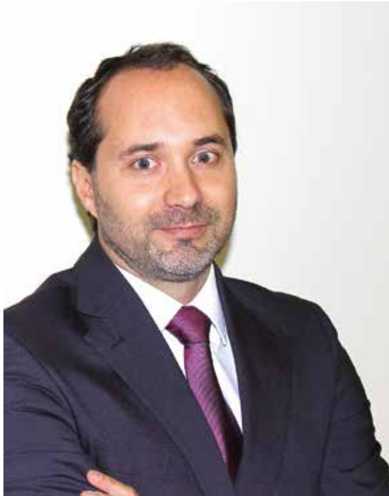
Guto Moisés/Office Press

PLANEJAMENTO E INVESTIMENTO A LONGO PRAZO FAZEM PARTE DA SEGURANÇA FINANCEIRA PARA O FUTURO