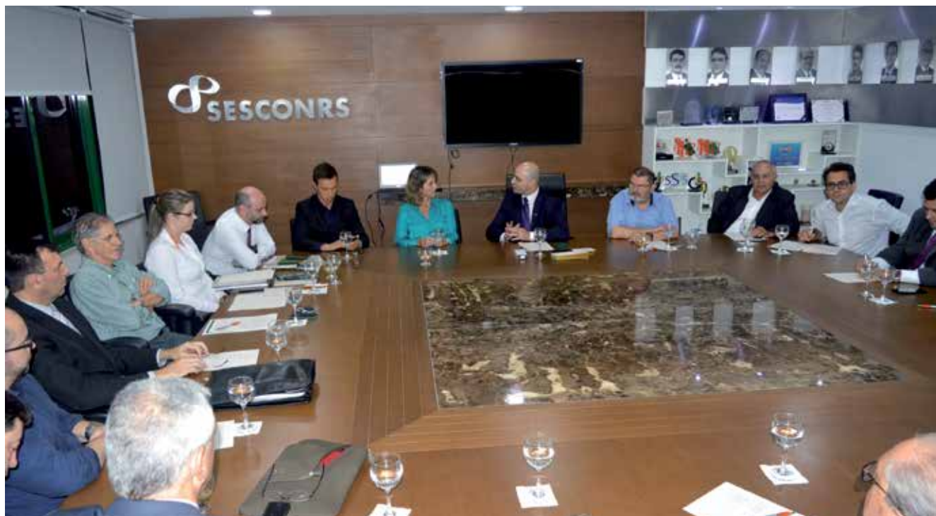
DIRETORIA DE 2017 RECEBENDO PRESIDENTE DA FEDERASUL