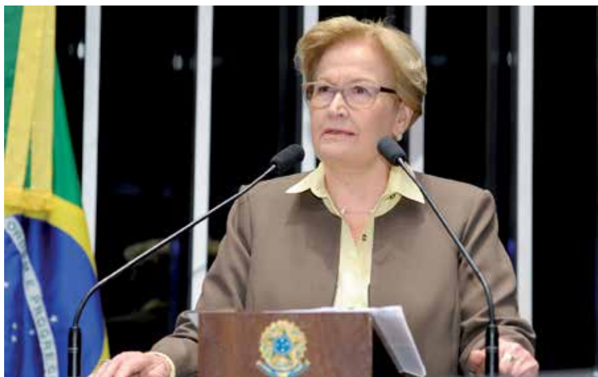
SENADORA ESTEVE EM DEBATE DO IMPOSTO DE RENDA NO SESCON-RS

“E a mobilização da sociedade e de entidades, assim como faz o SESCON-RS, apoiando a iniciativa, é importante para pressionar os parlamentares pela aprovação.”