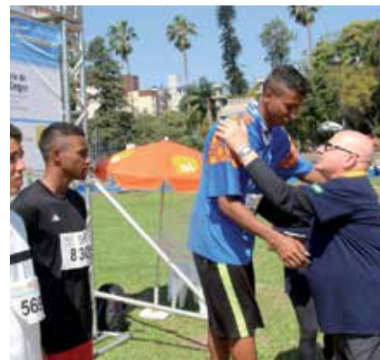
CAMPEÕES FORAM À GRÉCIA