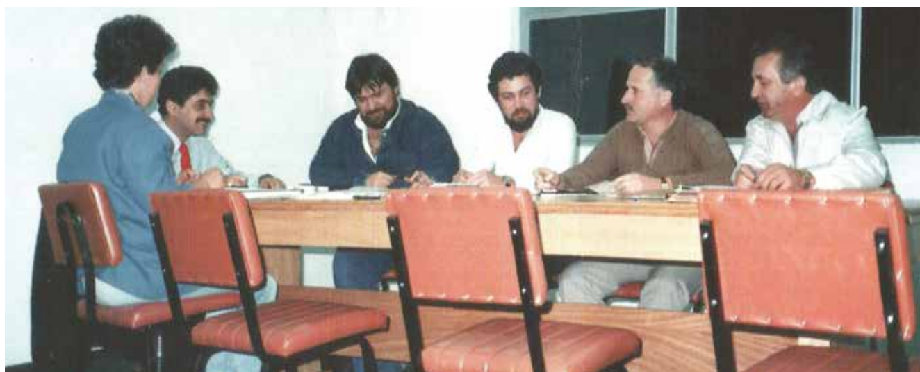
PRIMEIRA REUNIÃO DA DIRETORIA, EM 1987