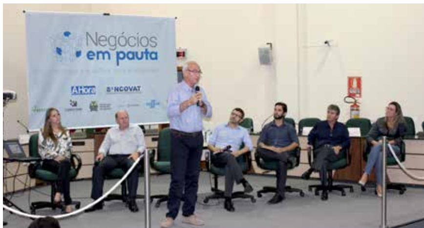
EVENTO COM APOIO DO SESCON-RS FOI EM ESTRELA

O Negócios em Pauta busca despertar a importância da qualificação na administração das empresas. “Queremos sensibilizar as pequenas organizações para