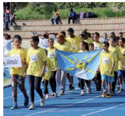
1º TORNEIO DE ATLETISMO