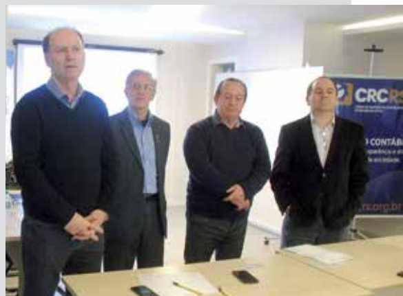
CECHIN (E) E LIDERANÇAS CONTÁBEIS

A prestação de contas feita pela prefeitura demonstra a o grande entrosamento mantido entre as entidades que compõem o Espaço Contábil e a nova administração municipal.