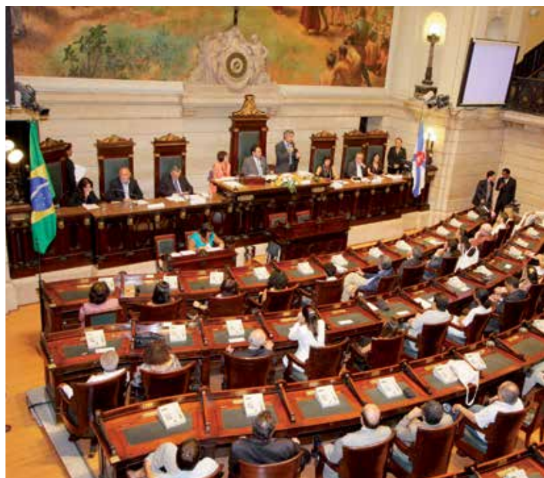
CÂMARA MUNICIPAL DO RIO DE JANEIRO

As despesas legislativas nas capitais brasileiras, regra geral, têm apresentado evolução acima da inflação. Em termos per capita , Palmas, Boa Vista e Florianópolis, no ano de 2015, apresentaram as maiores despesas per capita entre as capitais com menos de um milhão de habitantes.