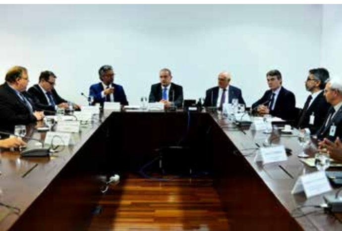
REUNIÃO COM O MINISTRO ONYX LORENZONI