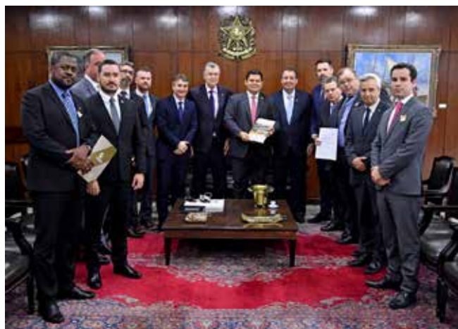
DAVI ALCOLUMBRE RECEBEU CARTA DE ESTEIO

de cada segmento. Além desses, também receberam a comitativa os deputados Baleia Rossi e Aguinaldo Ribeiro, protagonistas do texto da Reforma Tributária. “É importante encontrarmos uma agenda comum entre segmentos distintos de nossa economia. Por isto apoiamos as reformas que simplifiquem a apuração dos impostos, não aumentem a carga tributária e respeitem as especificidades de cada ente da federação e dos setores da economia. Tanto o ministro Onyx, quanto o Presidente Alcolumbre se mostraram sensíveis ao