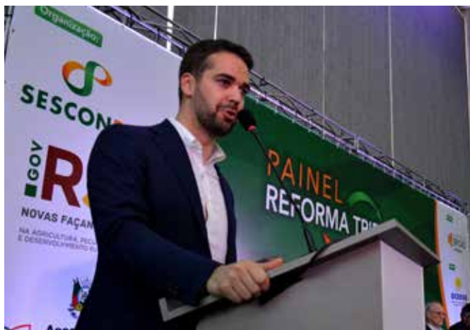
GOVERNADOR EDUARDO LEITE

criada por Governo de Estado, Assembleia Legislativa, SESCON-RS e Sistema Ocergs recebeu adesão de outras importantes entidades gaúchas e de âmbito nacional. O resultado foi a grande mobilização que culminou com a entrega do documento aos protagonistas das discussões em nível federal. “Senti-