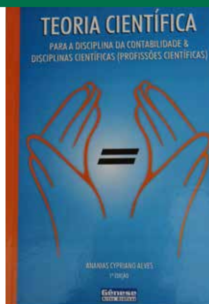
ESCRITOR SOBRE TÉCNICAS CONTÁBEIS

na Igreja Vicente Pallotti, entre outros momentos em que o som do seu saxofone encantou o coração da plateia. Seu repertório acústico vai desde músicas clássicas a MPB e, também, do faroeste americano, em particular a música Vale do Rio Vermelho