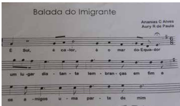
AUTOR DA SINFONIA BALADA DO IMIGRANTE

Além das aulas particulares, ele buscou aperfeiçoamento no Instituto Musical Toscanini e se preparou para os palcos da vida. Era o momento de mostrar suas músicas, como fez ao se apresentar nos eventos de Contadores e no SESCON-RS. Em especial, na noite de Natal, quando tocou Noite Feliz